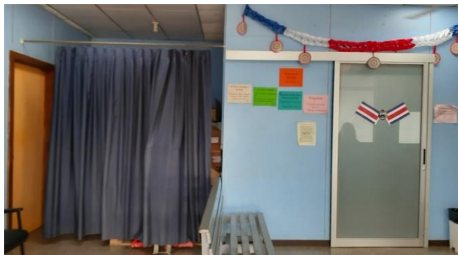
Fuente: Laboratorio Clínico, Área de Salud Garabito.