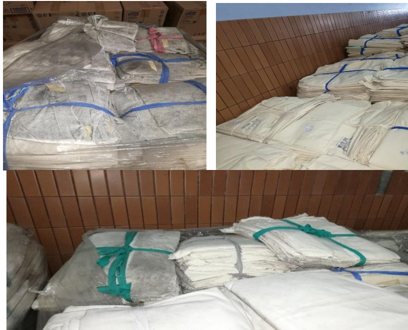
Imagen 10 y 11 Pasillos obstruidos