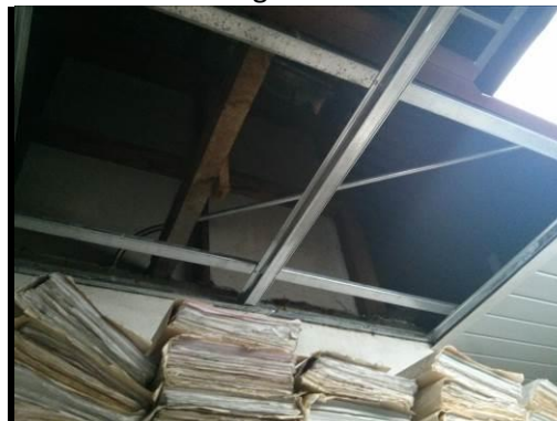
Condición encontrada el 17 de marzo de 2015