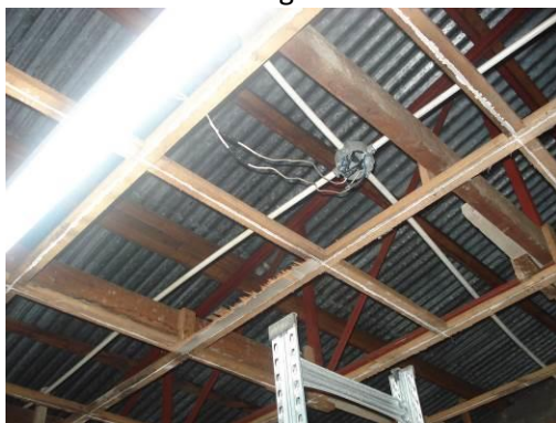
Condición Evidenciada al 20 de abril de 2010