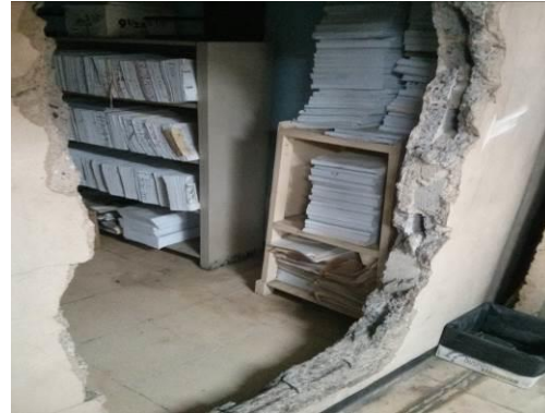
Condición encontrada el 17 de marzo de 2015