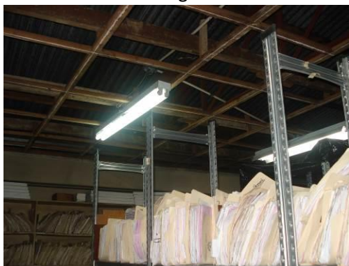
Condición Evidenciada al 20 de abril de 2010