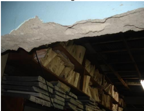
Condición Evidenciada al 20 de abril de 2010