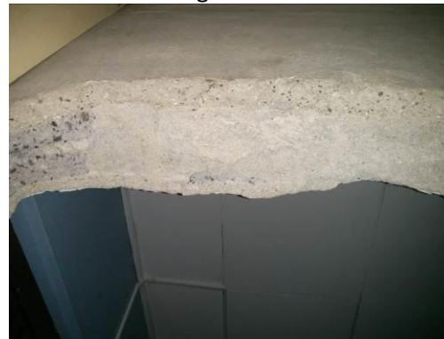
Condición encontrada el 17 de marzo de 2015