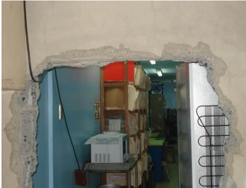
Condición Evidenciada al 20 de abril de 2010