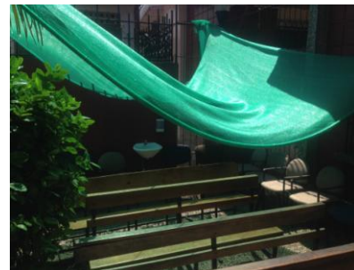
Sala de espera LAB.