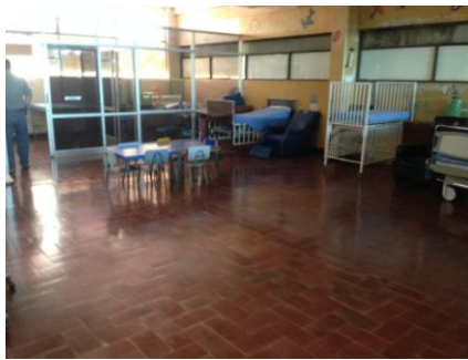
Salón de Pediatría HDLA