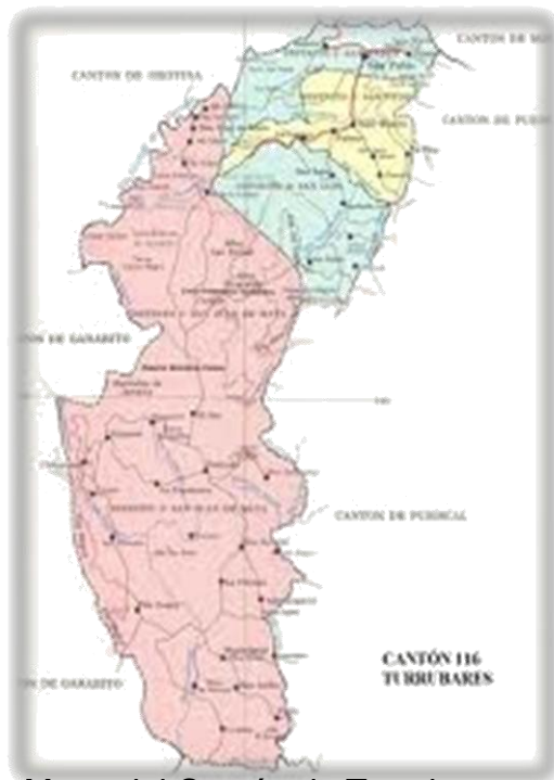
Mapa del Cantón de Turrubares