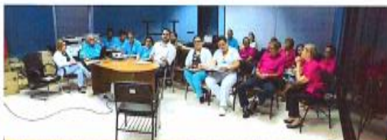
Abordaje de temas de interés para la comunidad Insuficiencia Renal