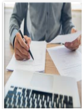
Informe de la aplicación de la BMC al 25% en los Seguros de Salud y de Pensiones

1 Observaciones para mejorar las conclusiones presentadas