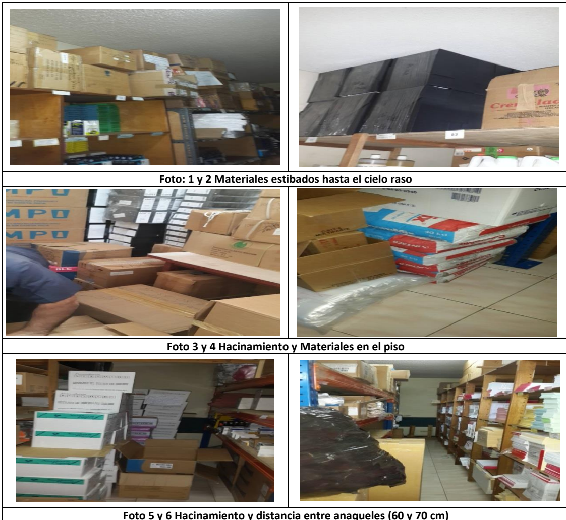
Fotografías 1 al 6 Proveeduría Área Salud Paraíso Cervantes

Fuente: Proveeduría- Área Salud Paraíso Cervantes.