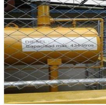
Tanque capacidad 434 litros

Las Normas de control interno para el Sector Público indican, en el punto 1.2, que el Sistema de Control Interno (SCI) de cada organización debe coadyuvar al cumplimiento de los objetivos, como el de proteger y conservar el patrimonio público contra pérdida, despilfarro, uso indebido, irregularidad o acto ilegal. El SCI debe brindar a la organización una seguridad razonable de que su patrimonio se dedica al destino para el cual le fue suministrado y de que se establezcan, apliquen y fortalezcan acciones específicas para prevenir su sustracción, desvío, desperdicio o menoscabo. Además, en el apartado 1.4, de la responsabilidad del jerarca y los titulares subordinados sobre el SCI, establece la emisión de instrucciones a fin de que las políticas, normas y procedimientos para el cumplimiento del SCI, estén debidamente documentadas, oficializadas y actualizadas, y sean divulgadas y puestas a disposición para su consulta. Por otra parte, el apartado 3.1, sobre la valoración del riesgo, establece que el jerarca y los titulares subordinados, según sus competencias, deben definir, implantar, verificar y perfeccionar un proceso permanente y participativo de valoración del riesgo institucional, como componente funcional del SCI. Las autoridades indicadas deben constituirse en parte activa del proceso que al efecto se instaure.