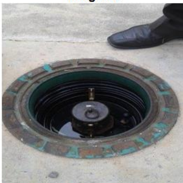
Acople de descarga, sin cerradura