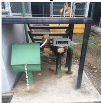
Sistema de medición de flujo (María)