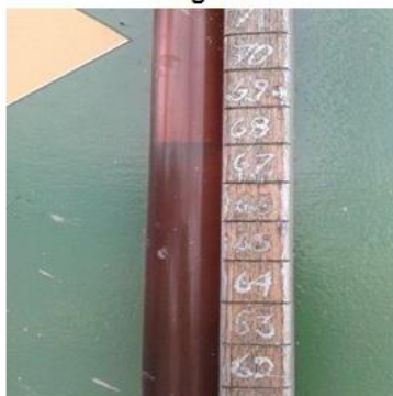
Sistema para la medición de volumen del Tanque