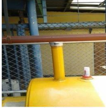
Tapas de tubería sin cerradura