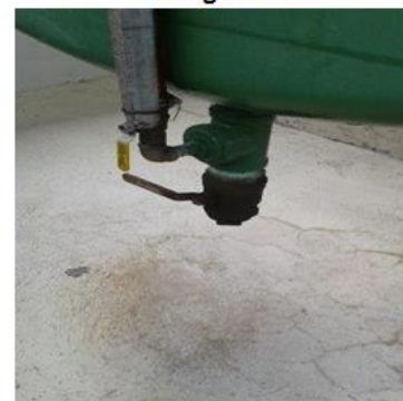
Llave de paso ubicada debajo del tanque