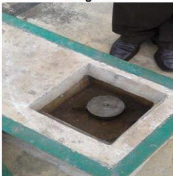
Tubería de vacío, sin cerradura