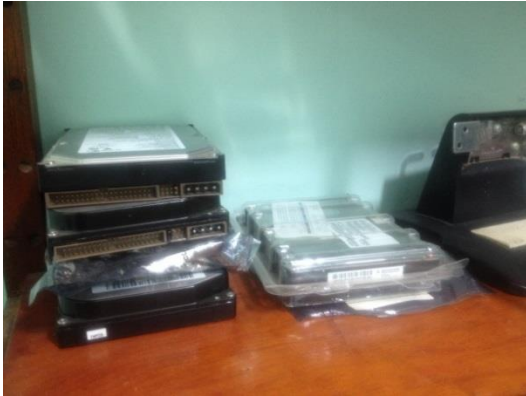
Fotografía 3: Repuestos de TIC