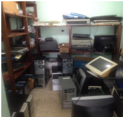
Fotografía 1: Bodega de Equipos y Repuestos de TIC