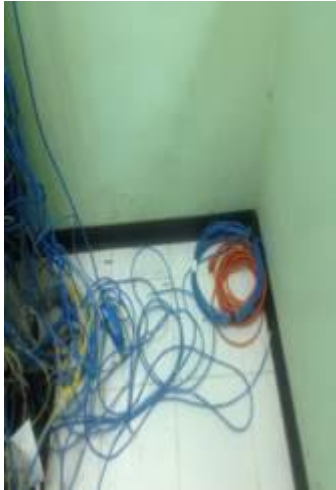
Fotografía 3: Cables en el piso