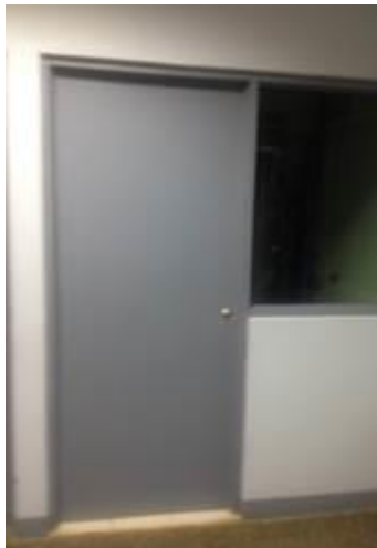
Fotografía 5: Acceso al cuarto de telecomunicaciones