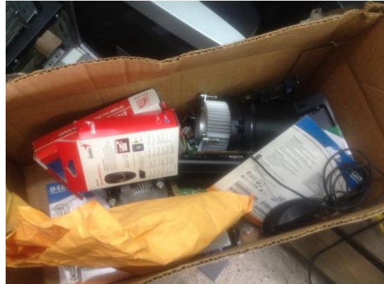
Fotografía 4: Repuestos de TIC