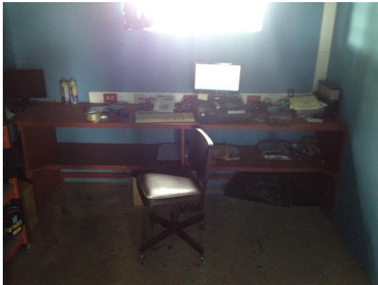
Fotografía 5: Oficina Técnico a cargo del mantenimiento preventivo y correctivo de TIC