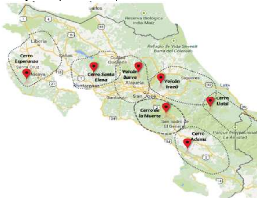
Figura 2. Mapa de cobertura aproximada del sistema de radiocomunicación.