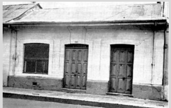
Primera sede de la Caja Costarricense del Seguro Social, 1941 ; la misma se ubicaba en San José, entre calles 3 y 5 sobre la avenida 3 , frente al edificio de URIBE Y PAGES.

En este momento la CCSS cuenta con 29 hospitales, 104 áreas de salud, 1039 EBAIS y 725 puestos de visita periódica, con el propósito de ofrecer a la población costarricense una oferta de servicio de gran amplitud.