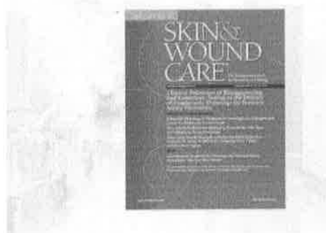
Figure 6. COLLAGEN DRESSINGS