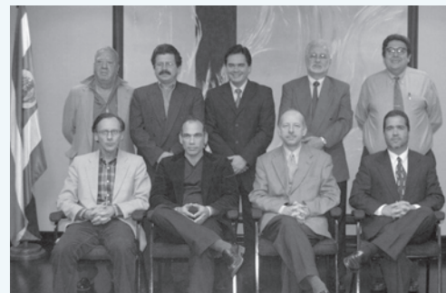
Junta Directiva, Caja Costarricense de Seguro Social

El cual establece la obligación de desarrollar las acciones necesarias para garantizar la calidad de atención y la seguridad del paciente.